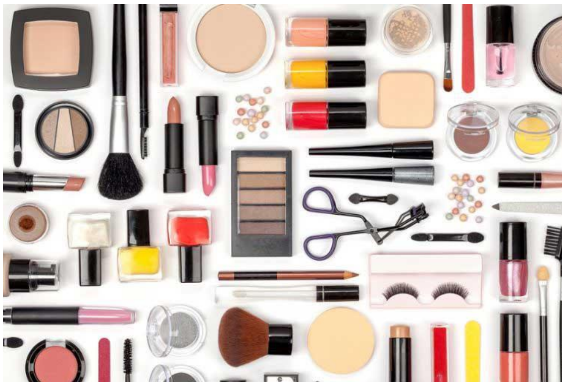
لوازم آرایشی دخترانه